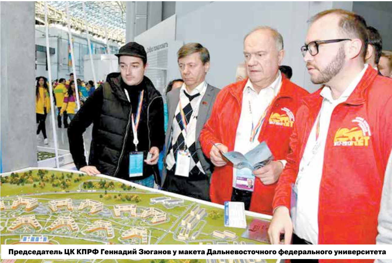
Председатель ЦК КПРФ Геннадий Зюганов у макета Дальневосточного федерального университета