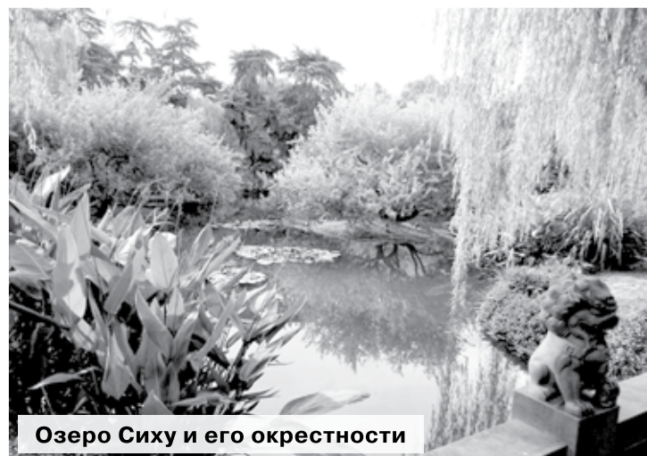
Озеро Сиху и его окрестности

Сегодня город знаменит своими чайными плантациями и природными красотами, наиболее известной из которых является озеро Сиху, или «Западное озеро».