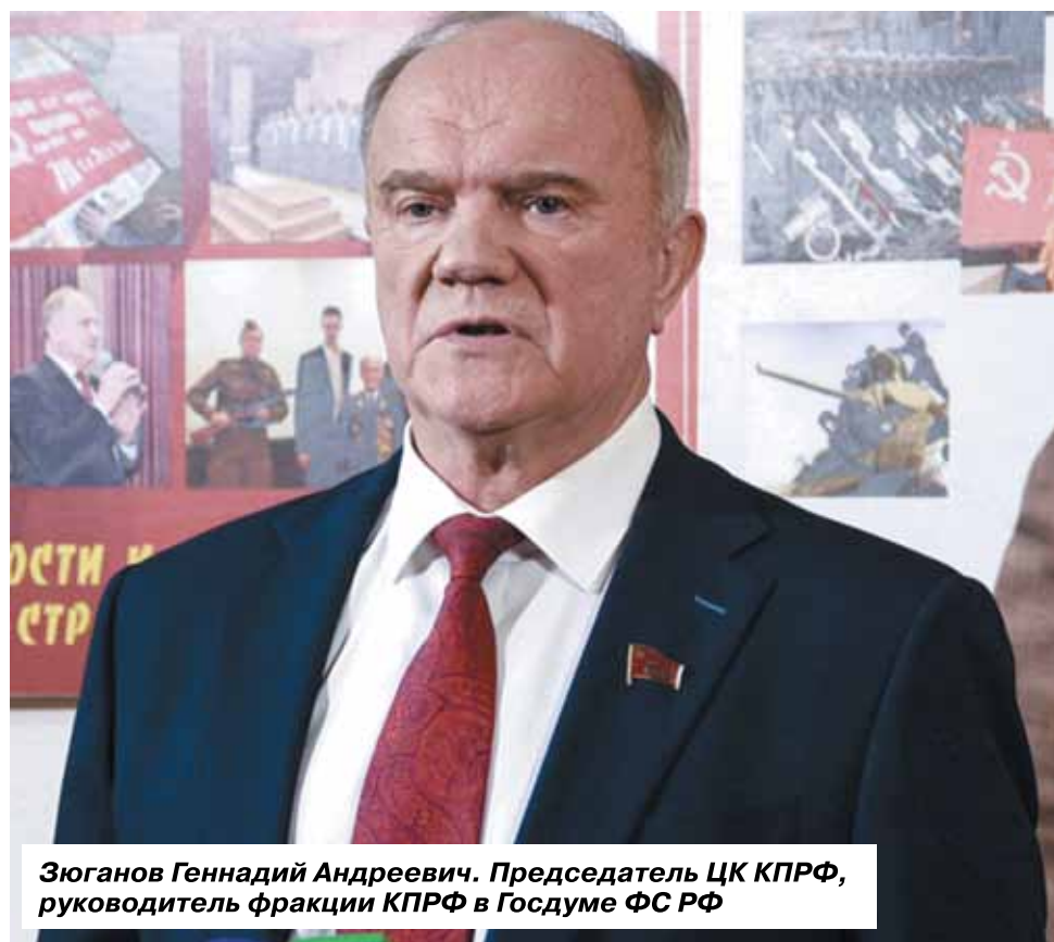
Зюганов Геннадий Андреевич. Председатель ЦК КПРФ, руководитель фракции КПРФ в Госдуме ФС РФ

Туманные обещания японской стороны не размещать на островах военные базы США не могут ввести нас в заблуждение. Нам уже обещали не продвигать НАТО на восток. В итоге войска НАТО уже чувствуют себя хозяевами во всех странах Восточной Европы, проводят провокационные учения на наших