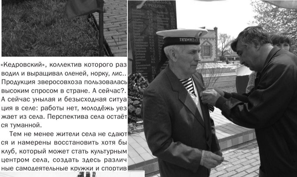
«Кедровский», коллектив которого разводил и выращивал оленей, норку, лис... Продукция зверсовхоза пользовалась высоким спросом в стране. А сейчас? А сейчас унылая и безысходная ситуация в селе: работы нет, молодёжь уезжает из села. Перспектива села остаётся туманной.

Тем не менее жители села не сдаются и намерены восстановить хотя бы клуб, который может стать культурным центром села, создать здесь различные самодеятельные кружки и спортив-