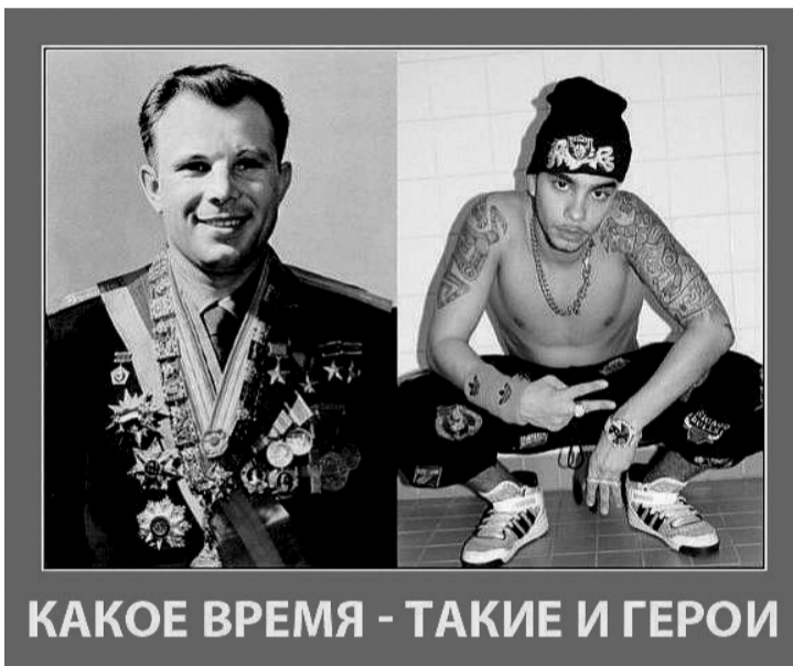
КАКОЕ ВРЕМЯ - ТАКИЕ И ГЕРОИ

кто забыл чувство гордости за деяния предков? Будет ли соперничать Родине тот, чьи святыни осмеяны, а память о Великой Победе над фашизмом подвергнута поруганию? И разве способна стать национальной идеей защита счетов, яхт и дворцов олигархов?