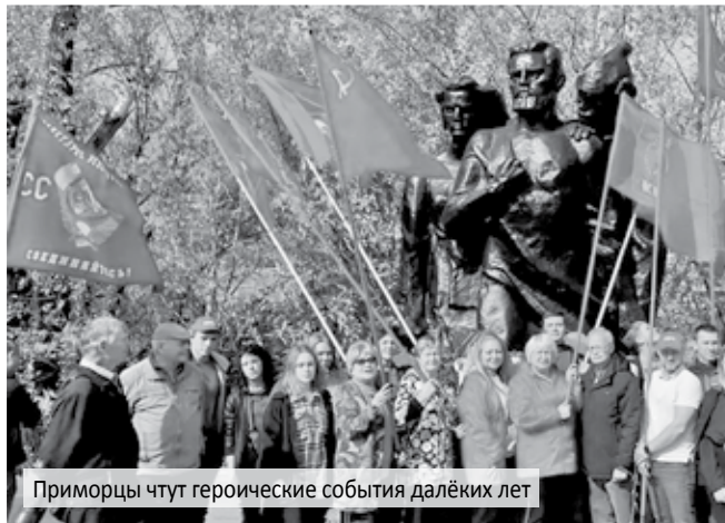
Приморцы чтут героические события далёких лет

И останутся как в сказках, Штурмовые ночи Спасска, Как манящие огни – Волочаевские дни.