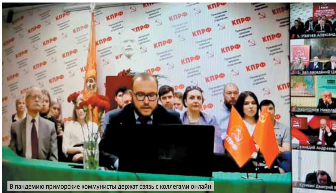
В пандемию приморские коммунисты держат связь с коллегами онлайн