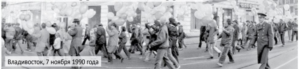
Владивосток, 7 ноября 1990 года

7 ноября 2021 года исполняется 104 года Великой Октябрьской социалистической революции.