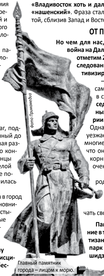
Главный памятник города – лицом к морю.

ИНТЕРЕСНАЯ ДЕТАЛЬ: 19 октября Троцкий прислал Уборевичу телеграмму, в которой требовал ввести в город только самые дисциплинированные части, причем ни в коем случае не допустить «бесчинств и грабежей».