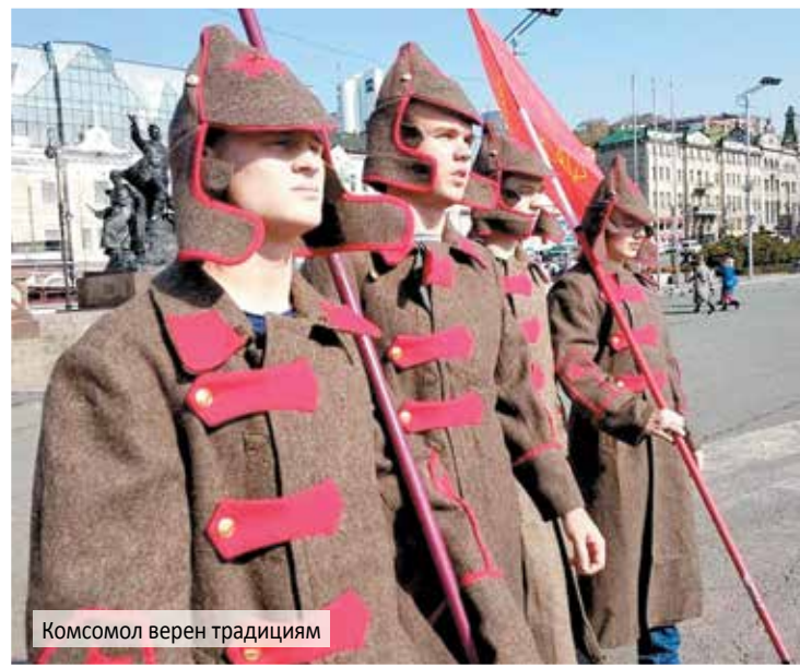
Комсомол верен традициям