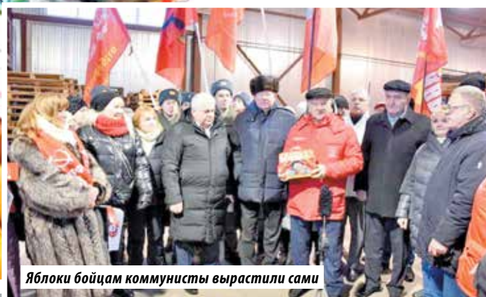
Яблоки бойцам коммунисты вырастили сами