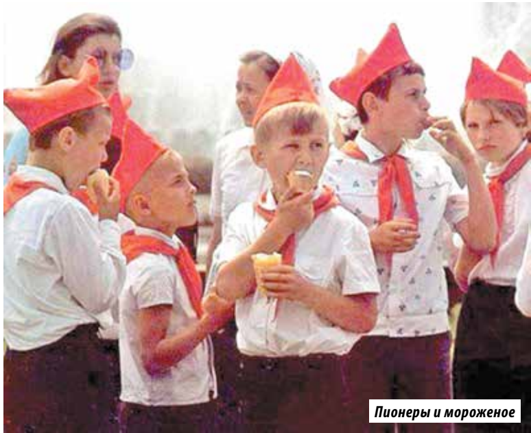
Пионеры и мороженое