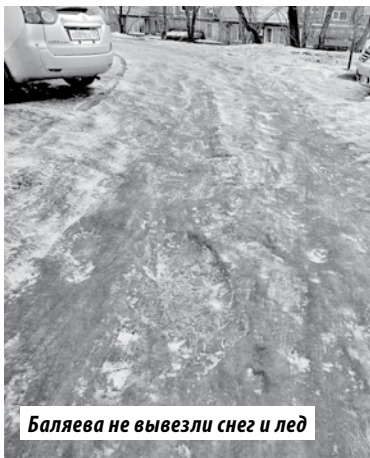
Баляева не вывезли снег и лед

Снеговая падь – название района в первые дни нового года полностью оправдало свое название, о его существовании коммунальщики полностью забыли.