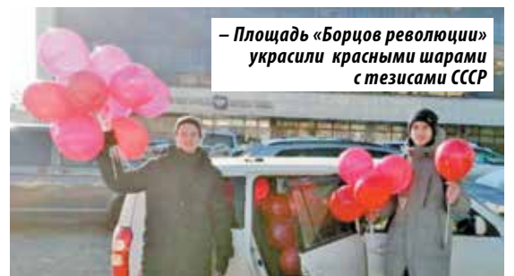
– Площадь «Борцов революции» украсили красными шарами с тезисами СССР