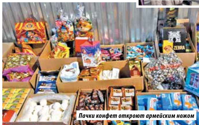
Пачки конфет откроют армейским ножом