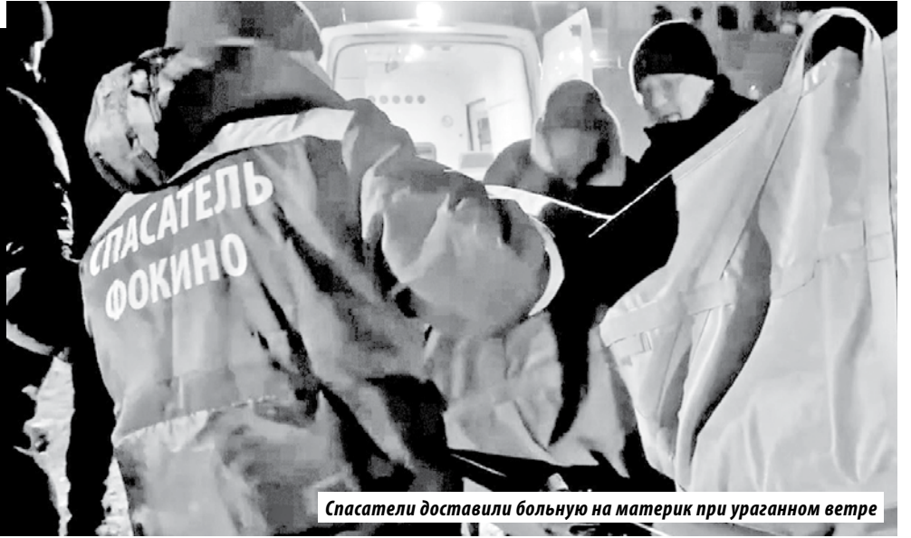
Спасатели доставили больного на материк при ураганном ветре