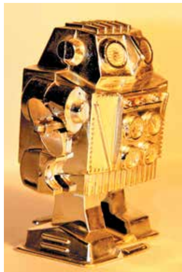
А заводных, шагающих роботов помните?

Заряжалась такая рогатка гладкой галькой или незрелыми