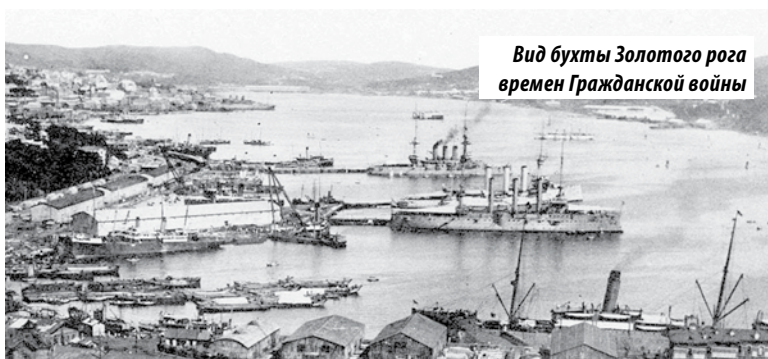
Вид бухты Золотого рога времен Гражданской войны