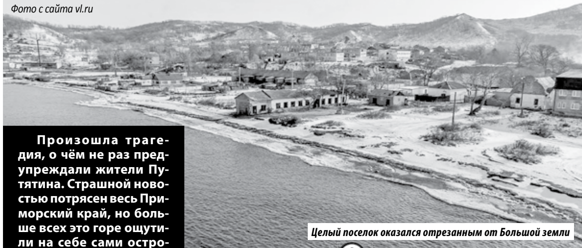
Целый поселок оказался отрезанным от Большой земли

Произошла трагедия, о чём не раз предупреждали жители Путятина. Страшной новостью потрясен весь Приморский край, но больше всех это горе ощутили на себе сами островитяне. Отрезанные от материка, они так и не дождались открытия зимней навигации. Для них не нашлось средства передвижения по морю, к поселку Дунай.