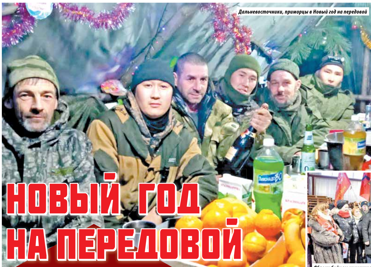
Дальневосточники, приморцы в Новый год на передовой