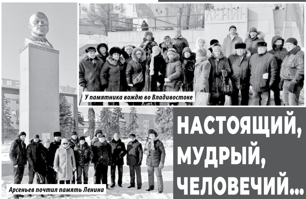
У памятника вождю во Владивостоке