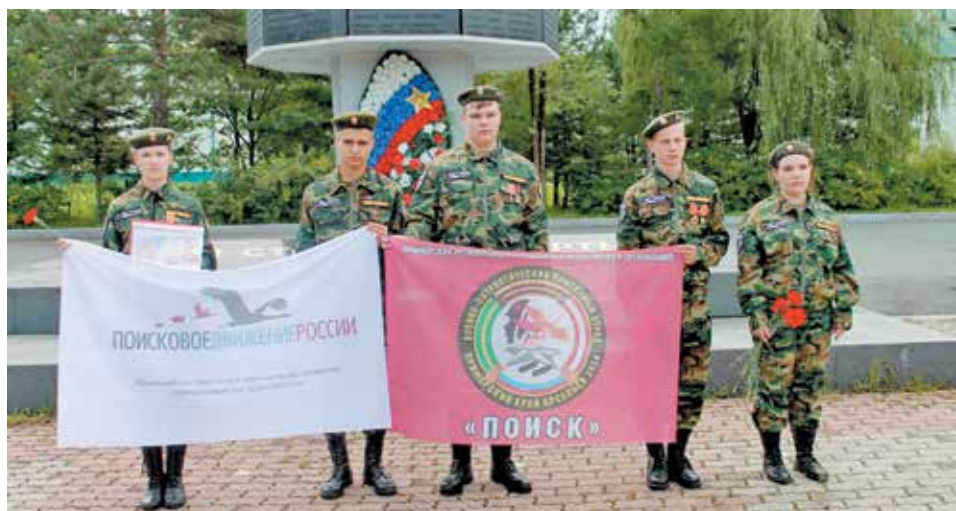
Проводы отряда в экспедицию под Сталинград, на раскопки в местах боев дальневосточных дивизий ▲

Торжественное мероприятие, посвященное 10-летию юбилею военно-патриотического поискового отряда «Поиск» г.Арсеньева и 81-й годовщине Победы Красной армии в Сталинградской битве прошло в ДК «Прогресс».