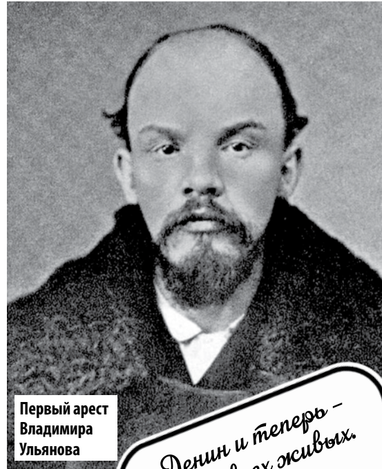
Первый арест Владимира Ульянова

Владимир Ильич Ленин посвятил всю свою жизнь непримиримой борьбе с системой угнетения и эксплуатации человека человеком, от которой еще в 1887 году пострадал его брат. В результате Великой Октябрьской социалистической революции пролетарии многих стран восстали против своих буржуазных правительств. Под знаменем марксизма-ленинизма рабочие Германии, Польши, Венгрии, Финляндии боролись за установление Советской власти в своих странах. Впоследствии ленинское учение о пролетарской революции и диктатуре пролетариата стало теоретическим оружием для рабочих всех стран.