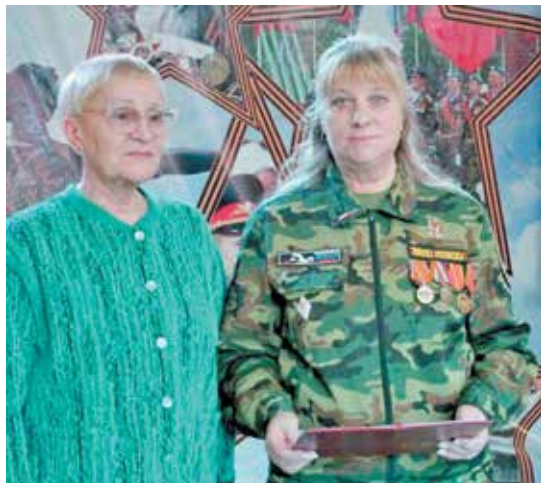
Командиру «Поиска» вручили грамоту главы Арсеньевского городского округа ▲