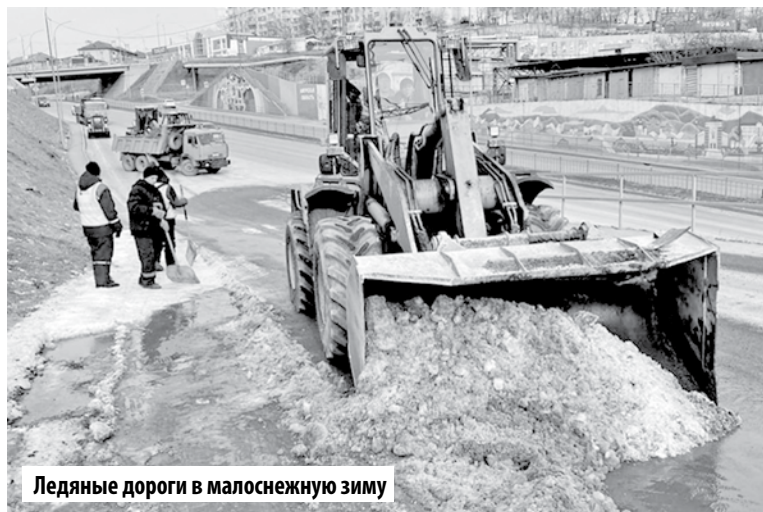
Ледяные дороги в малоснежную зиму

– Хорошо бы понимать – кому принадлежат сети, дабы не делать лишних запросов. Если меры по устранению течи не принимаются – обращаться следует в прокуратуру. Можно и