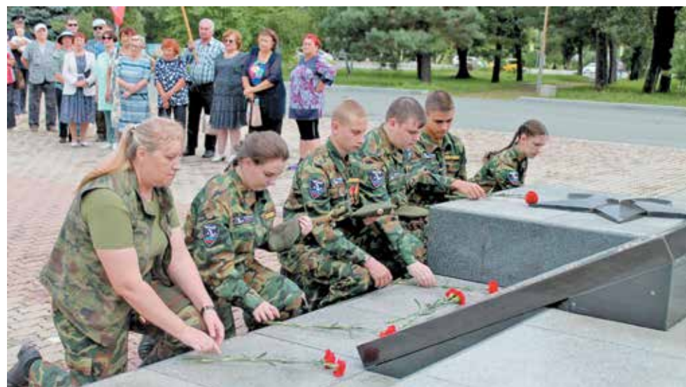
Возложение цветов к стеле погибших арсеньевцев в ВОВ и военных конфликтах ▲