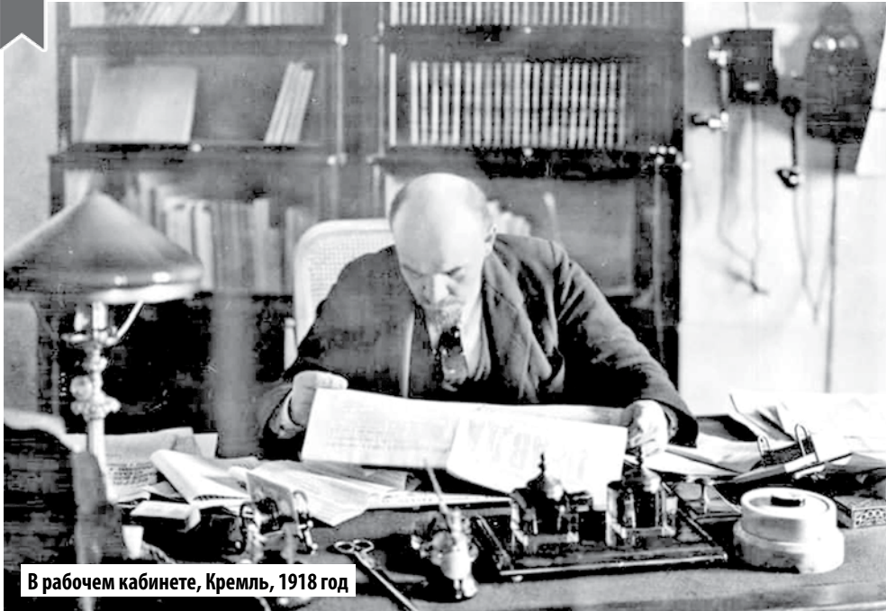
В рабочем кабинете, Кремль, 1918 год

Автор – Иван Чикаловец, Владивостокское городское отделение ЛКСМ