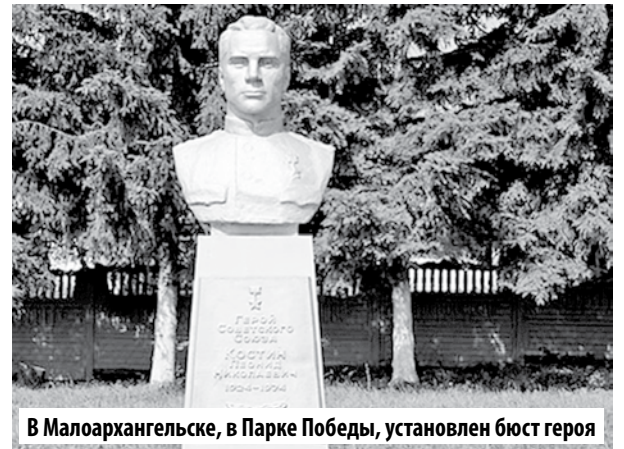
В Малоархангельске, в Парке Победы, установлен бюст героя