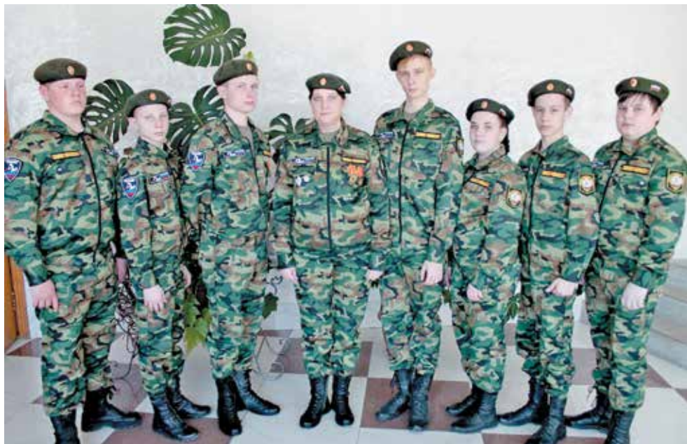
Они возвращают имена героев ▲

В 2015 году у входа в его родную школу появилась мемориальная доска, посвященная воину-интернационалисту.