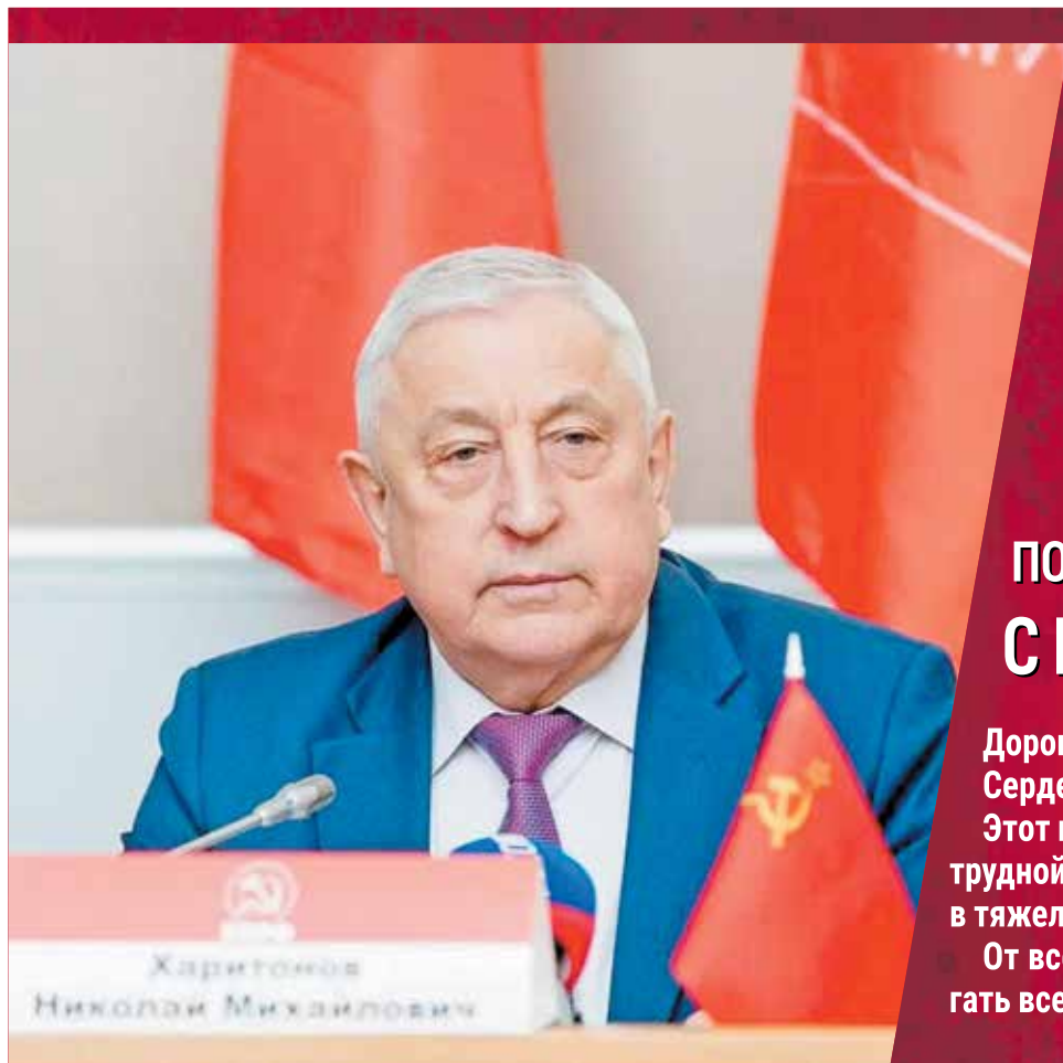
Харитонов Николай Михайлович

КАНДИДАТ НА ДОЛЖНОСТЬ ПРЕЗИДЕНТА ОТ КПРФ