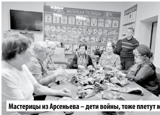
Мастерицы из Арсеньева – дети войны, тоже плетут маскировочные сети