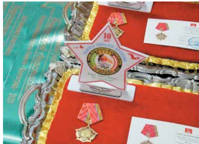
Юбилейные медали ЦК КПРФ, памятный знак "10 лет ВППО Поиск" ▲