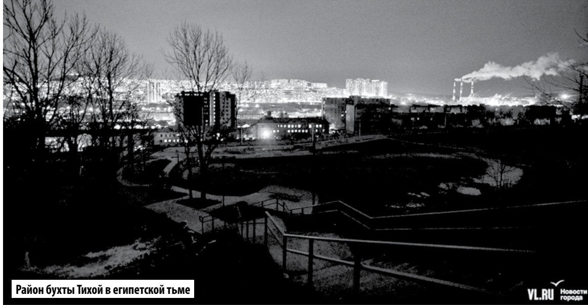
Район бухты Тихой в египетской тьме

КОММУНАЛЬНАЯ ИНФРАСТРУКТУРА НЕ ВЫДЕРЖИВАЕТ НИКАКОЙ КРИТИКИ!