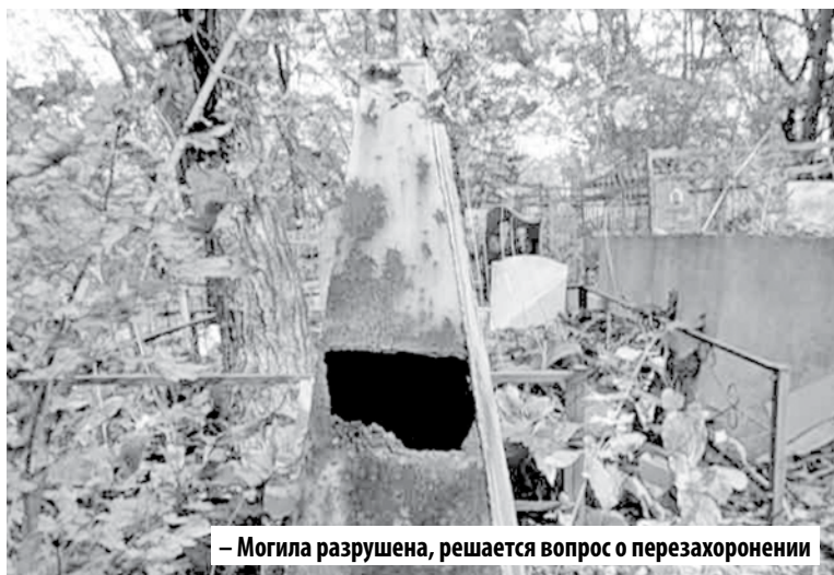
– Могила разрушена, решается вопрос о перезахоронении