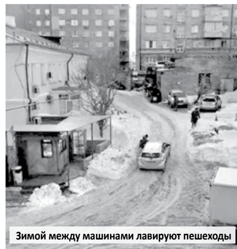
Зимой между машинами лавируют пешеходы