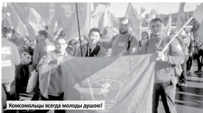
Комсомольцы всегда молоды душой!