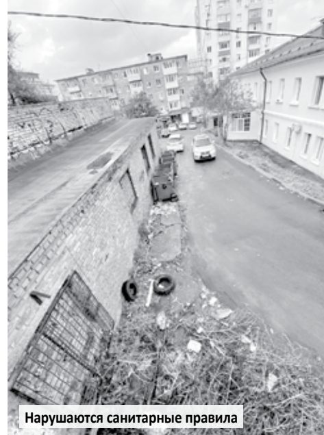
Нарушаются санитарные правила