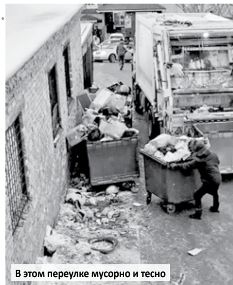
В этом переулке мусорно и тесно

На последнем собрании жителей микрорайона представители администрации города, наконец, завершила – мусорку перенесут с дороги, сделают тротуар. Работы запланированы на 3-4 квартал 2022 года. Надеемся, что эта история со счастливым финалом, и мэрия сдержит свои обещания.