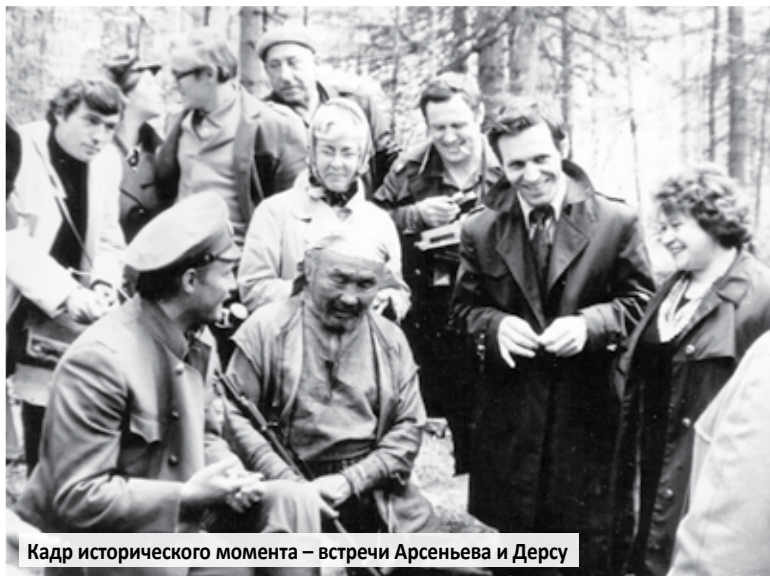
Кадр исторического момента – встречи Арсеньева и Дерсу