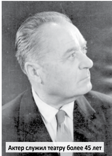
Актер служил театру более 45 лет

ГАЗЕТА «ПРАВДА ПРИМОРЬЯ» ПРОДОЛЖАЕТ РАССКАЗЫВАТЬ ОБ УЧАСТНИКАХ ВЕЛИКОЙ ОКТЯБРЬСКОЙ СОЦИАЛИСТИЧЕСКОЙ РЕВОЛЮЦИИ И ГРАЖДАНСКОЙ ВОЙНЫ, ПРИМОРЦАХ, ЗАХОРОНЕНИЯ КОТОРЫХ ОБНАРУЖЕНЫ НА МОРСКОМ И ЛЕСНОМ КЛАДБИЩАХ.