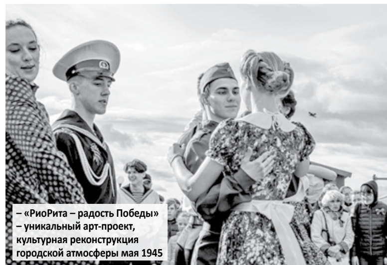
– «РиоРита – радость Победы» – уникальный арт-проект, культурная реконструкция городской атмосферы мая 1945

В процессе работы простирали взаимодействие с Общественной палатой Приморского края, вошла в её состав и стала председателем комиссии по развитию гражданского общества.