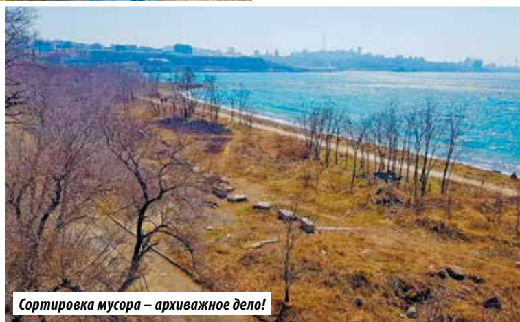
Сортировка мусора – архиважное дело!

Комсомольцы столкнулись со следующей проблемой: единственный мусорный бак в шаговой доступности оказался переполнен, а до ближайше-