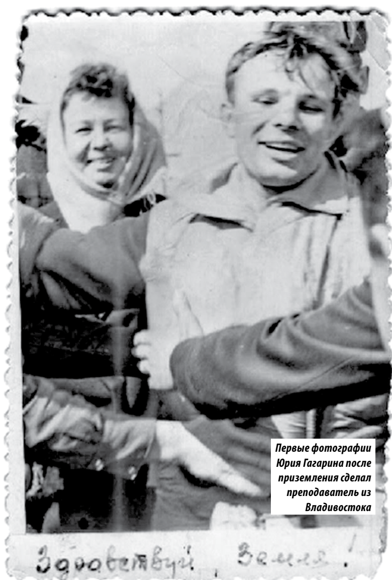
Первые фотографии Юрия Гагарина после приземления сделал преподаватель из Владивостока

62 года назад в одночасье простой смоленский паренёк Юрий Гагарин, с очаровательной улыбкой на лице, стал кумиром для миллионов людей во всём мире. Остались неповторимые воспоминания от встреч с этим удивительным человеком.