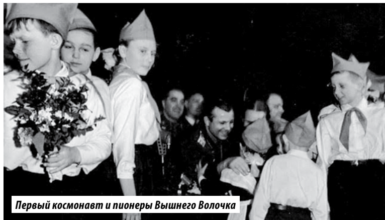
Первый космонавт и пионеры Вышнего Волочка

нес в часть. Купил перед уходом на службу «Зенит С». Меня, можно сказать, спасли от наказания. Свою роль сыграла благодарность министра обороны Малиновского – ему прислали снимки, которые я сделал. Потом он прислал благодарность командиру. Ее зачитывали перед частью. Но я тогда был уже в другом роде войск.