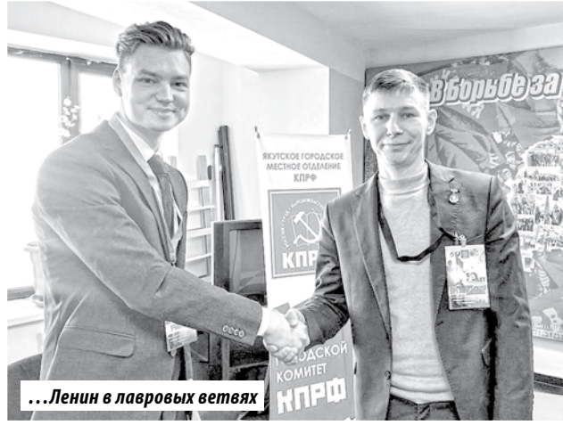
...Ленин в лавровых ветвях