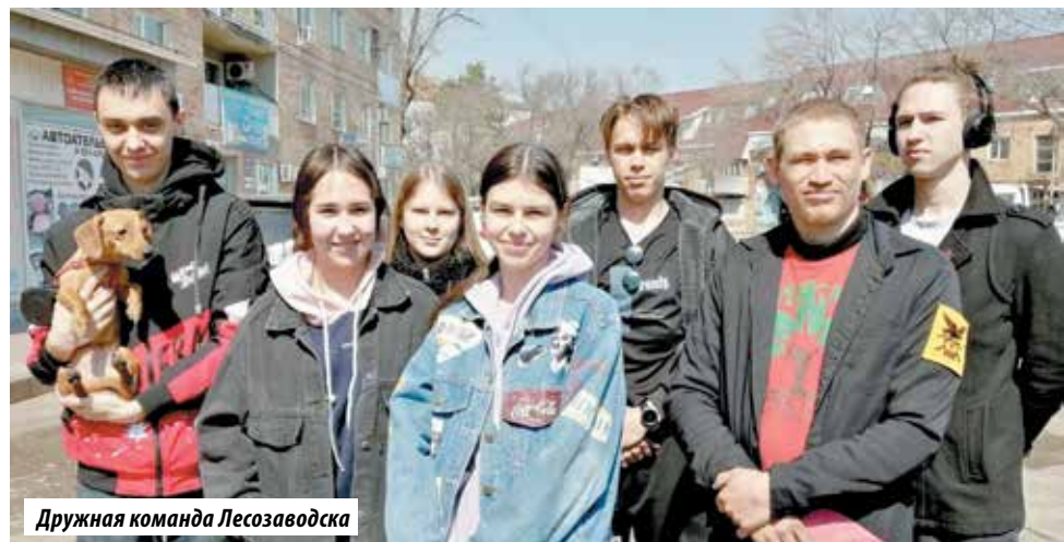
Дружная команда Лесозаводска