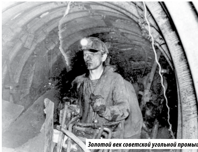
Золотой век советской угольной промышленности