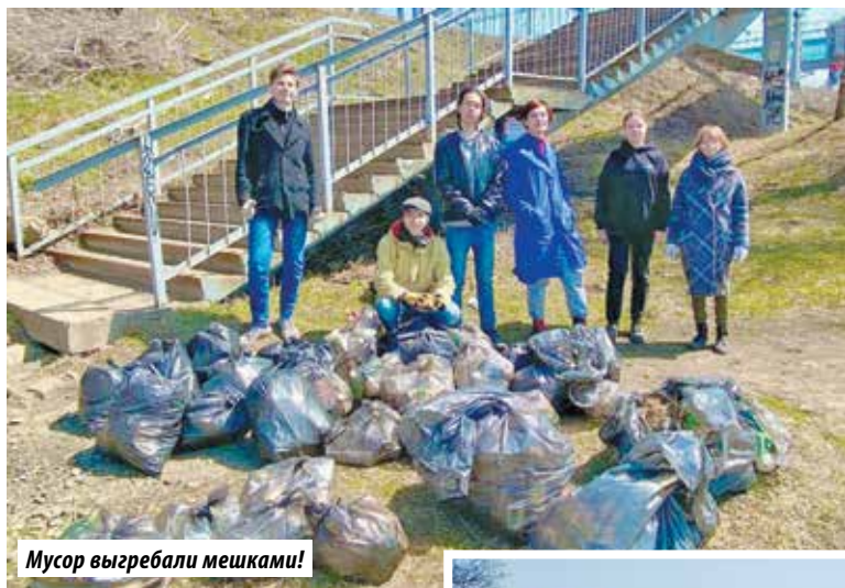
Мусор выгребали мешками!

– Мы рассортировали мусор таким образом, чтобы сте-