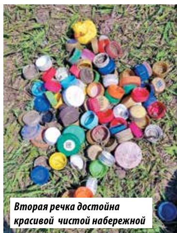
Вторая речка достойна красивой чистой набережной

кланные бутылки оказались в отдельных пакетах, – продолжает Артур Тимошенко. – Бутылок оказалось на месте значительно больше, чем мы думали, за редким исключением, большинство – из-под алкогольной продукции. Их мы отправили в пункты приёма стеклотары.