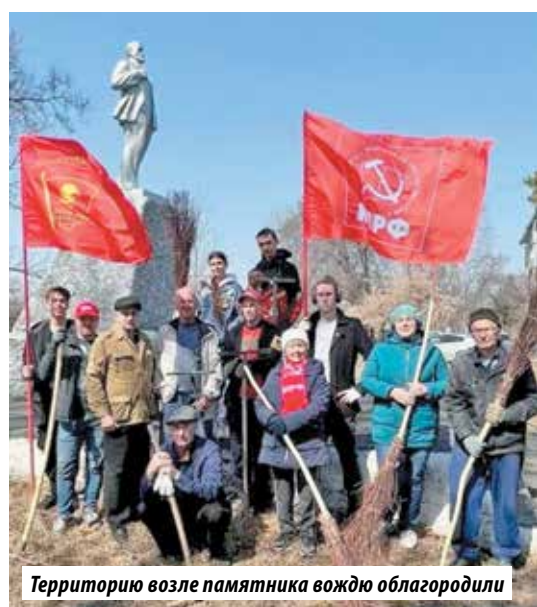
Территорию возле памятника вождю облагородили

8 апреля 2023 года комсомольцы Лесозаводска вместе со своими старшими товарищами из КПРФ провели субботник в парке у Дома культуры «Планета» Ружинского микрорайона.