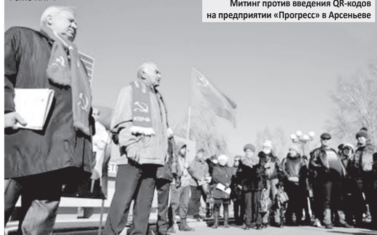
Митинг против введения QR-кодов на предприятии «Прогресс» в Арсеньеве

15 ноября жители Арсеньева сплотились и вышли на митинг. На мой взгляд, указ – грубейшее нарушение трудового законодательства. Одновременно подобные указы выпустили на Дальзаводе, выставив за порог 195 человек, на приморской ГРЭС в Лучегорске. В районные прокуратуры нами направлены депутатские запросы, отлично отреагировала прокуратура Пожарского района, отменив приказ. Тысячи людей вышли из производственного процесса, и это большой удар по экономике края.