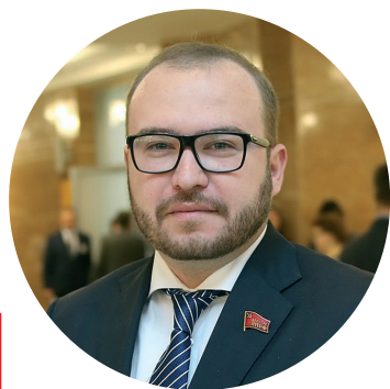
С уважением к вам, Первый секретарь Приморского краевого Комитета КПРФ, заместитель председателя Законодательного собрания Приморского края Анатолий Долгачёв

Дорогие приморцы! Товарищи! Земляки! ОТ ВСЕЙ ДУШИ ПОЗДРАВЛЯЮ ВАС С НАСТУПАЮЩИМ НОВЫМ ГОДОМ!