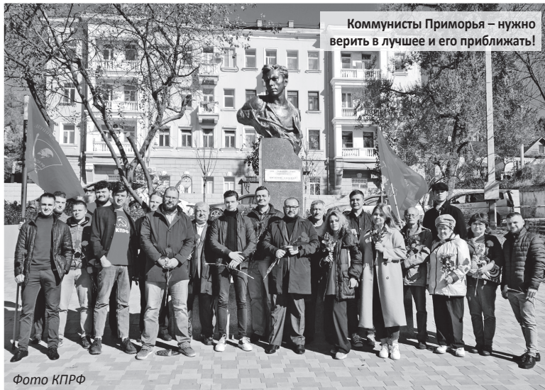
Коммунисты Приморья – нужно верить в лучшее и его приближать!

От всей души поздравляю избирателей с наступающим Новым годом! Накануне был в родном Арсеньеве – в центре города стоит красивая ёлка, много снега, настроение праздничное! Радуется, что лучшая традиция – установка сказочных ледяных фигур – сохранилась с советской эпохи. Спасибо нашим мастерам! Всем приморцам – мои самые наилучшие пожелания!