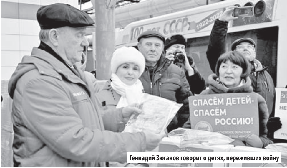
Геннадий Зюганов говорит о детях, переживших войну