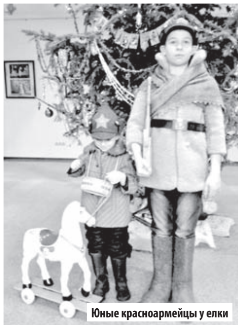
Юные красноармейцы у елки

В 20-Е ГОДЫ ПРАЗДНИК БЫЛ ОБЪЯВЛЕН НЕЖЕЛАТЕЛЬНЫМ «РЕЛИГИОЗНЫМ ПЕРЕЖИТКОМ» – ВМЕСТЕ С РОЖДЕСТВОМ И ДЕДОМ МОРОЗОМ.