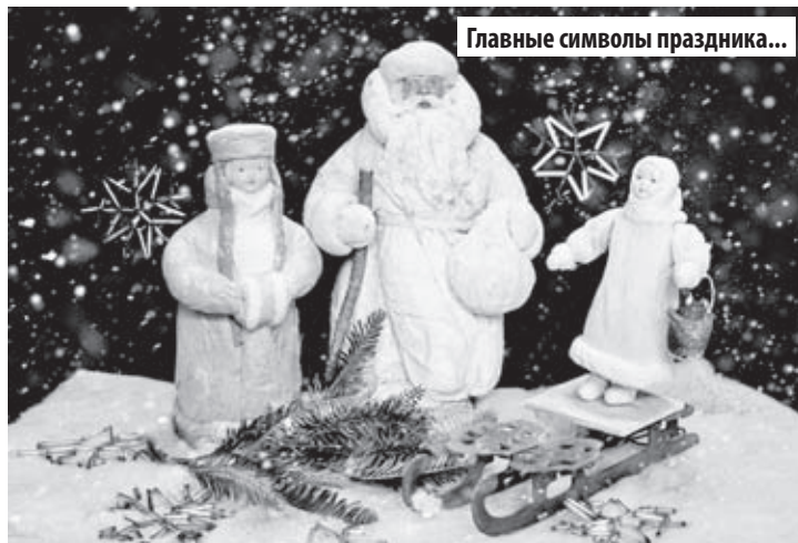
Главные символы праздника...