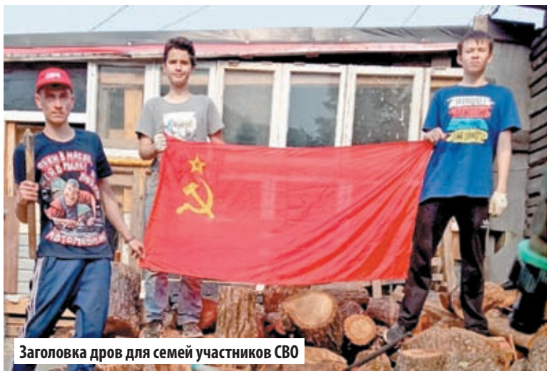
Заготовка дров для семей участников СВО