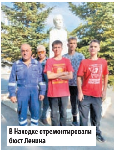
В Находке отремонтировали бюст Ленина

«Мы не готовы мириться с тем, что граждане первой в мире социалистической страны принесли такую большую жертву и так отчаянно сражались против нацизма ради того, чтобы в 2023 году молодёжь была интернационалистом и социалистом в подворотнях, портила стены домов и разжигала международную вражду!» – единодушно открыто высказались комсомольцы.