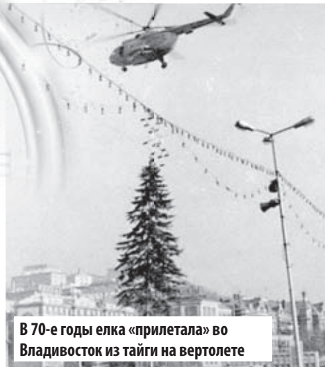
В 70-е годы елка «прилетала» во Владивосток из тайги на вертолете

1961 год – во Владивостоке работает 18 елок, 28 катков и 30 детских горок. Во всех клубах и Домах культуры, кинотеатрах и школах проводятся вечера и карнавалы, демонстрации кинофильмов. Детей на зимние каникулы отправляют в лагерь: «Строитель», «Седанка», в