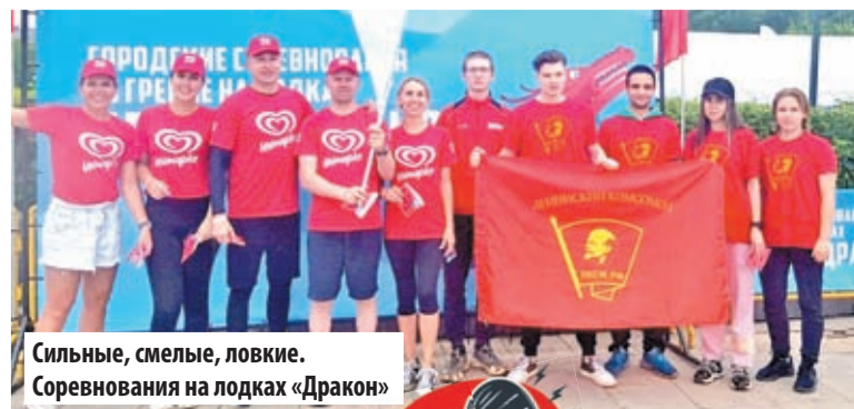
Сильные, смелые, ловкие. Соревнования на лодках «Дракон»

Комсомол – это свет надежды, непременно красного цвета! Для меня это не просто организация, а самые настоящие друзья и верные товарищи на всю жизнь.