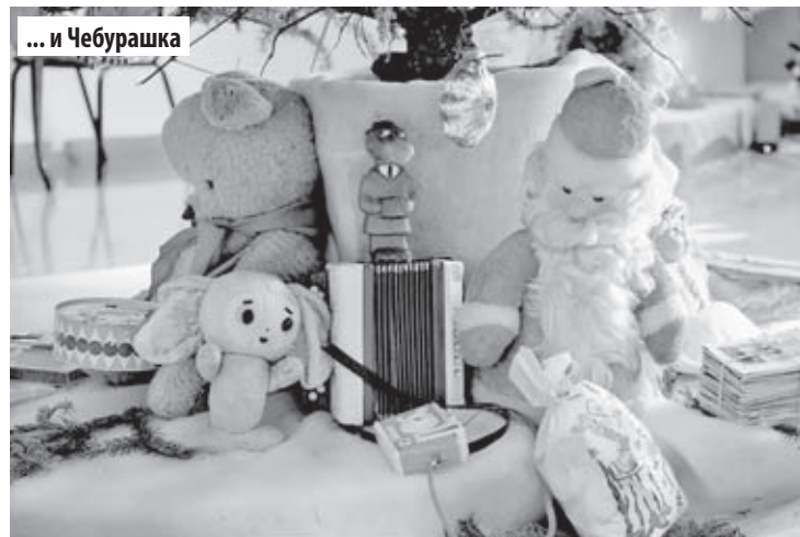
... и Чебурашка

«Красное знамя» 1929 год. В этот канун Рождества не было видно седобородых Дедов Морозов и елочных блесток: рабочая кооперация не занималась продажей поповских игрушек. Целые заводы дали обещание: «Вместо рождественского пьянства – культурный отдых!» 24 декабря вечером зал клуба Ильича был переполнен.: с интересом слушали «Предрождественский доклад». Вечер закончился антирелигиозной постановкой драмкружка.