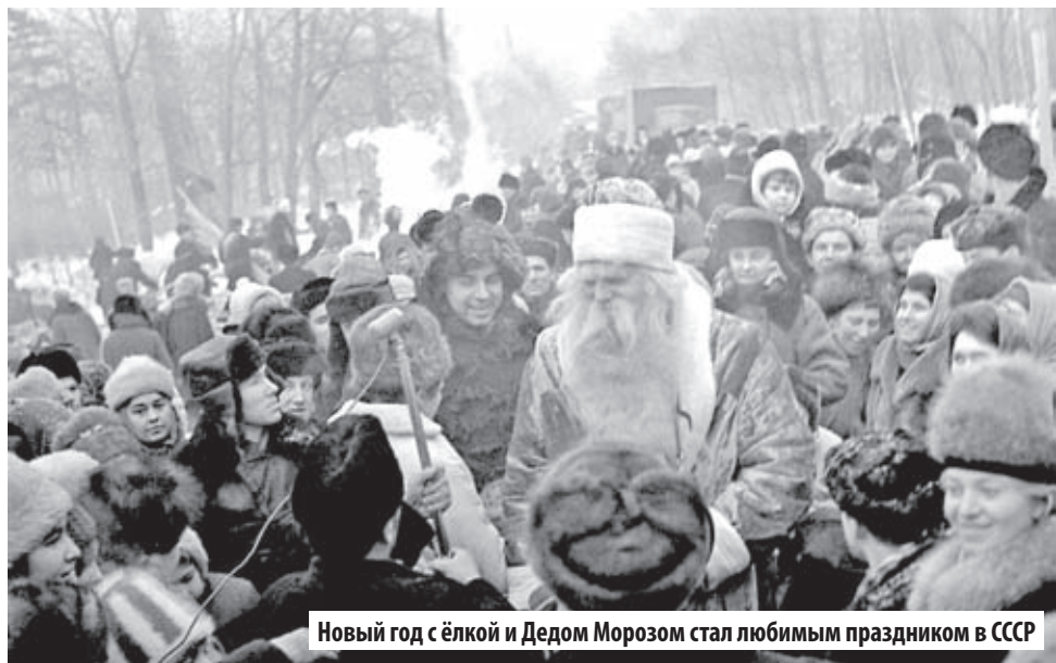
Новый год с ёлкой и Дедом Морозом стал любимым праздником в СССР

В первые годы Советской власти Ленин лично устраивал для детей елки. Сохранились воспоминания о том, что в 1919 году Владимир Ильич поехал в Сокольники навестить жену. Там же были организованы утренники для ребятшек из детских домов. Ленин сам водил хоровод вокруг ёлки, пел песни, играл с детьми в кошки-мышки. После того как на дереве зажглась иллюминация, устроенная местным электриком, «ликванию и радости детей не было конца, и все закружились в дружном хороводе вокруг ёлки, которая переливалась разноцветными огоньками».