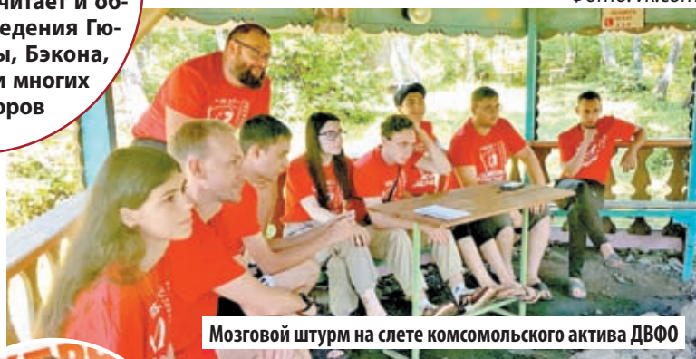
Мозговой штурм на слете комсомольского актива ДВФО

Одним из направлений работы наших доблестных комсомольцев стал Книжный клуб. Молодёжь читает и обсуждает произведения Гюго, Кампанеллы, Бэкона, Островского и многих других авторов