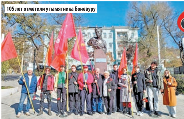
105 лет отметили у памятника Боневуру

МЕСТНЫЕ ОТДЕЛЕНИЯ КОМСОМОЛЬСКОЙ ОРГАНИЗАЦИИ АКТИВНО РАБОТАЮТ ВО ВЛАДИВОСТОКЕ, НАХОДКЕ, ЛЕСОЗАВОДСКЕ, ОКТЯБРЬСКОМ, АРТЕМОВСКОМ, СПАССКОМ, ФОКИНСКОМ РАЙОНАХ.