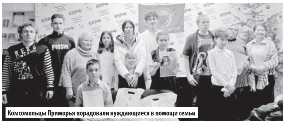
Комсомольцы Приморья порадовали нуждающиеся в помощи семьи