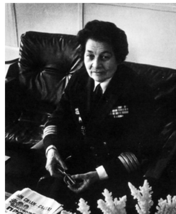
Первая в мире женщина-капитан дальнего плавания Анна Ивановна Щетинина. Владивосток, 1978.

До 1990 года Владивосток практически всегда по всем социально-экономическим показателям шёл впереди Хабаровска, жители которого по доброму завидовали жителям нашего города. На фоне многолетнего административного безделья в Приморье в последние лет 15-17 ситуация коренным образом изменилась. Уже владивостокцы завидуют Хабаровску,