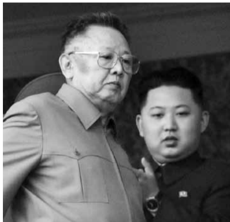
Ким Чен Ир и Ким Чен Ын

В этой идее отражается благородный дух любви к людям, считающий народные массы самым дорогим и могущественным капиталом государства. Поэтому добросовестно служить людям, твердо опираться на них при решении всех вопросов, поклоняться народу, как небу — это основной принцип Трудовой партии Кореи в государственном строительстве, главный вектор её