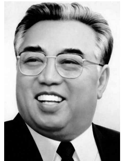
Ким Ир Сен

Лозунг «Всё — на благо народа, во всем опираться на народ!» стал повседневной практикой деятельности ТПК и государства.