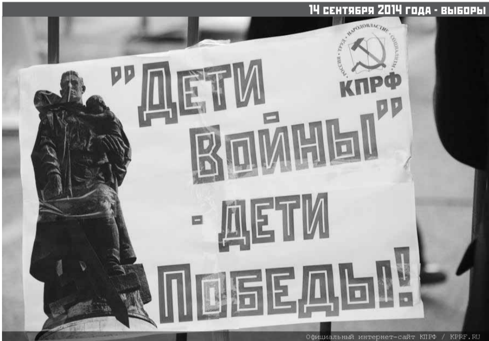
Официальный интернет-сайт КПРО / KPRF.RU