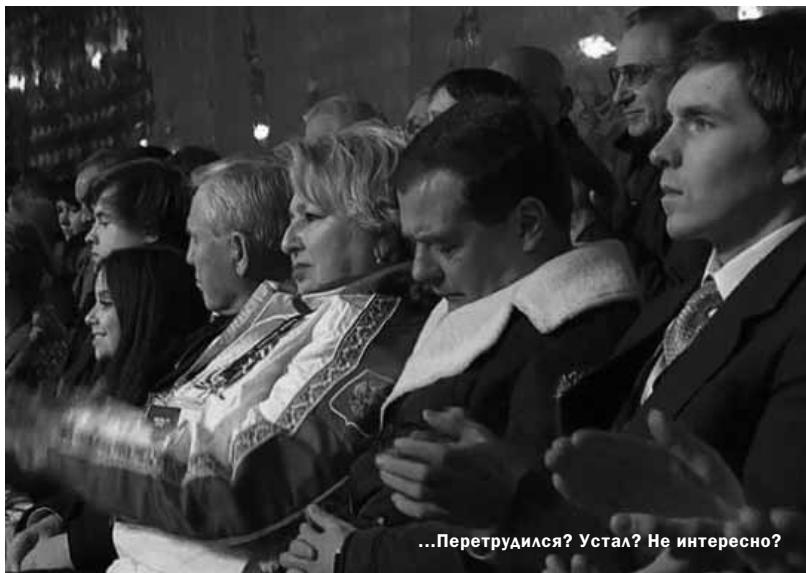
...Перетрудился? Устал? Не интересно?