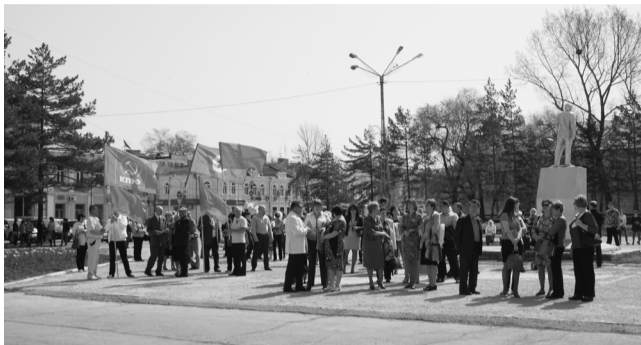
Праздник 1 Мая в Спасске-Дальнем.