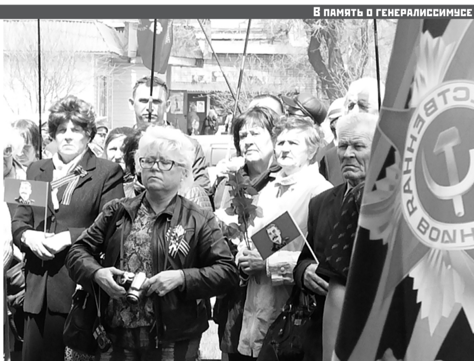
В ПАМЯТЬ О ГЕНЕРАЛИССИМУСЕ