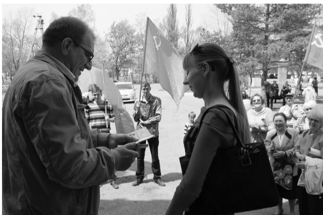
Во время праздничных первомайских акций в Артёме были вручены комсомольские и партийные билеты вступившим в ряды КПРФ и ЛКСМ новым товарищам.