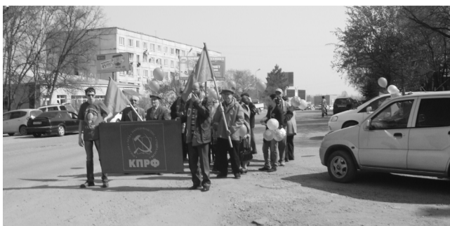
Демонстрация в Лесозаводске.