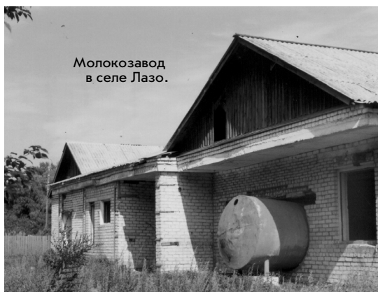
Молокозавод в селе Лазо.