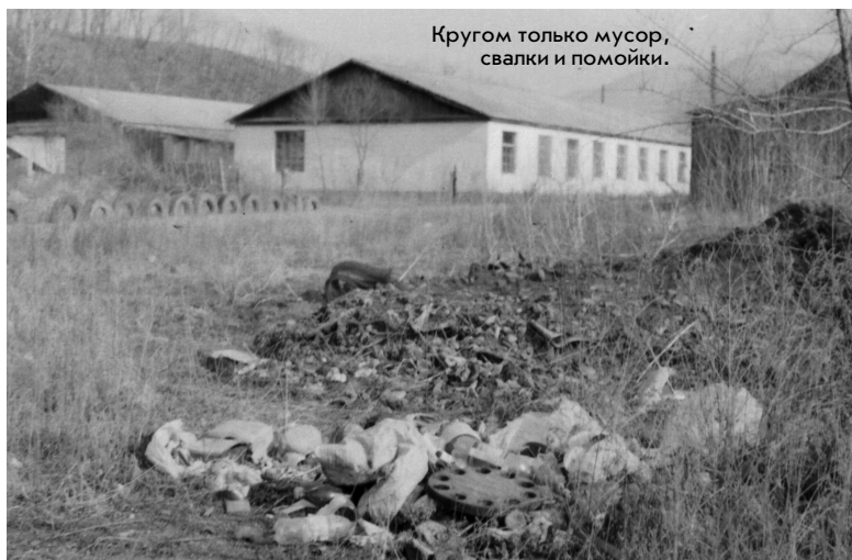
Кругом только мусор, свалки и помойки.