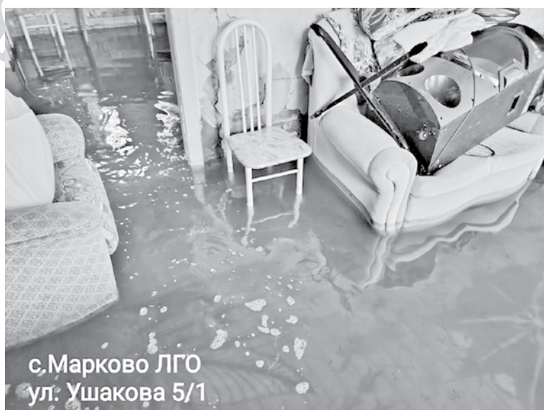
с. Марково ЛГО ул. Ушакова 5/1

17 апреля Константин Банцеев провёл рабочее совещание по вопросу «снижения