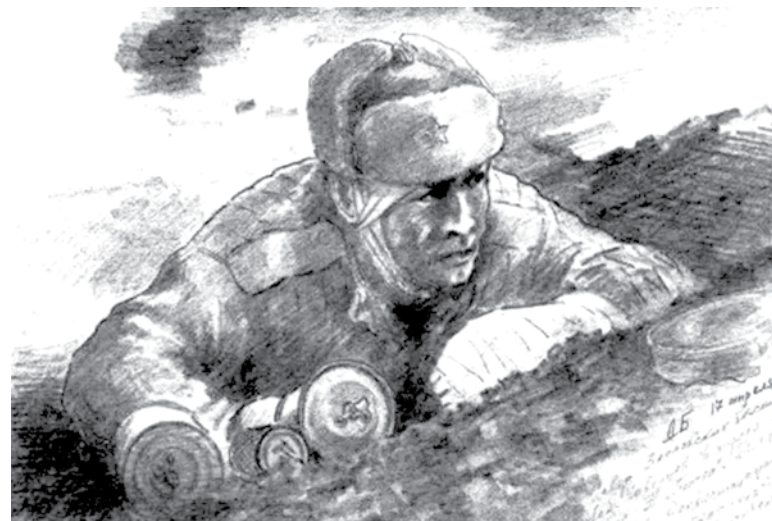
Советский солдат в окопе кидает гранату.

На улице Вилкова был построен один из первых супермаркетов в городе, на Ильичёва установлена стела воинам-тихоокеанцам – на месте ворот Владивостокского пересыльного лагеря.