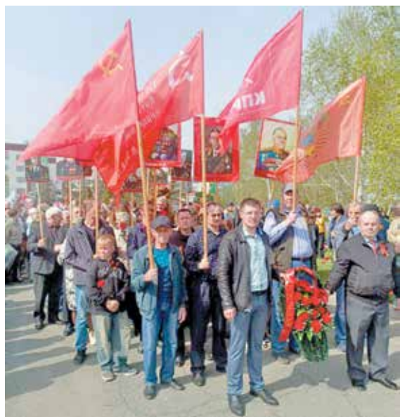
Арсеньевское местное отделение КПРФ. В одном строю

80-летие Победы СССР в Великой Отечественной войне достойно отметили коммунисты Приморья