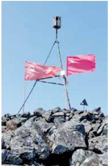
Покорение приморскими коммунистами горы Голец в честь праздника 9 мая!

Велика наша Родина. На многие тысячи километров пролегли ее границы с запада на восток. Одна из самых отдаленных ее окраин – поселок Пограничный, бывший Гродеково. Пограничный внес свой вклад в разгром фашизма на нашей земле. Отсюда в годы войны было призвано в действующую армию более 4000 человек.