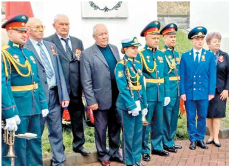
Пограничный. Мемориал на сопке Снеговая. 9 мая 2025 год

Каждый город и поселок Приморского края по праву гордится воинами Великой Отечественной войны!