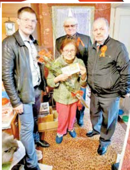
В гостях у ветерана