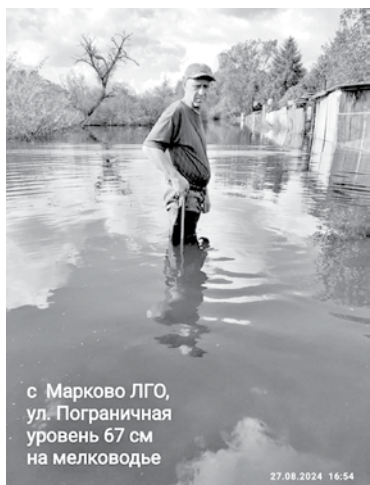
с. Марково ЛГО, ул. Пограничная уровень 67 см на мелководье