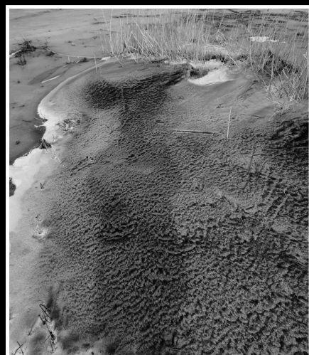
Народ Хакасии против открытой перевалки