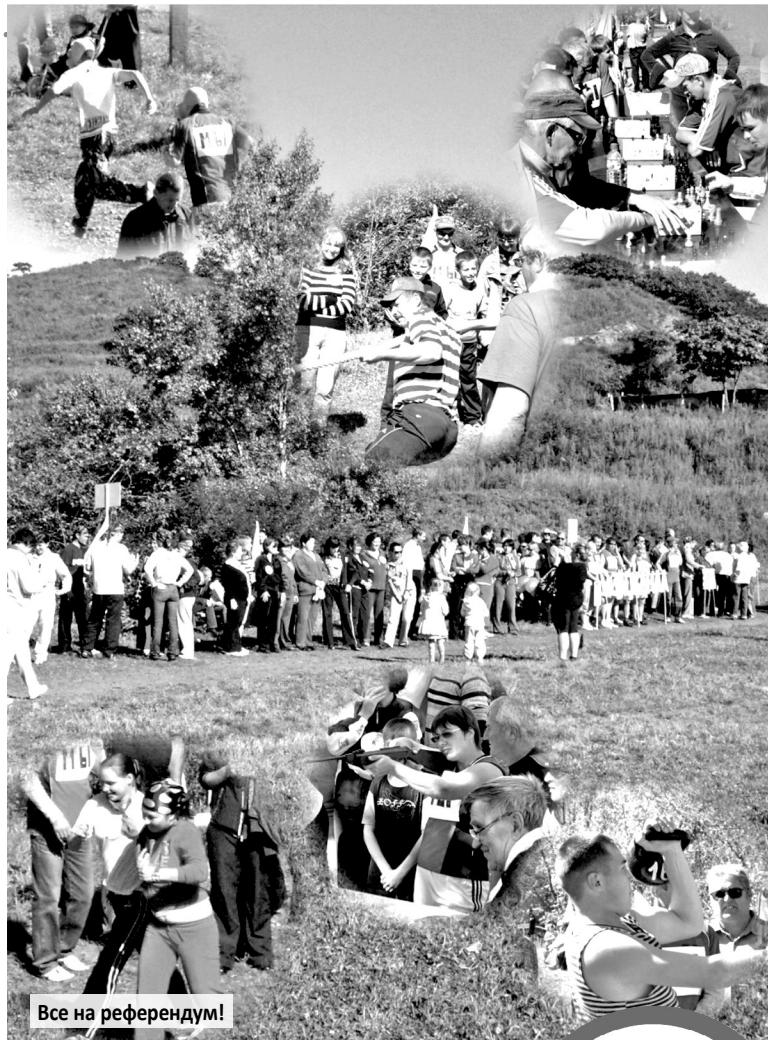
Все на референдум!