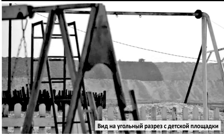
Вид на угольный разрез с детской площадки

– ОТКРЫТАЯ ПЕРЕВАЛКА УГЛЯ ГУБИТЕЛЬНО СКАЗЫВАЕТСЯ НА КАЧЕСТВЕ ЖИЗНИ, И ЧИНОВНИКАМ СЛЕДУЕТ ИГНОРИРОВАТЬ ЭТО