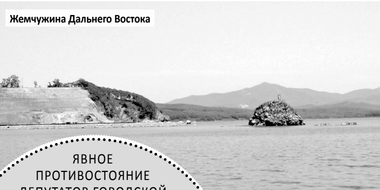
Жемчужина Дальнего Востока

НА ЭТАПЕ ГОЛОСОВАНИЯ В ГОРОДЕ ФОКИНО 90% ПРИСУТСТВОВАВШИХ БЫЛИ СОТРУДНИКАМИ АДМИНИСТРАЦИИ. ПРОСТЫХ ЖИТЕЛЕЙ НЕ ПУСТИЛИ ВВИДУ ОТСУТСТВИЯ МЕСТ. ЖИТЕЛИ ПОСЁЛКА ДУНАЙ ПРОГОЛОСОВАЛИ КАТЕГОРИЧЕСКИ ПРОТИВ ВНОСИМЫХ ИЗМЕНЕНИЙ В ГЕНПЛАН И ПЗЗ. ВСЕ НАРУШЕНИЯ ОПИСАНЫ В ЖАЛОБЕ ГЛАВНОМУ ПРОКУРОРУ ПРИМОРСКОГО КРАЯ.