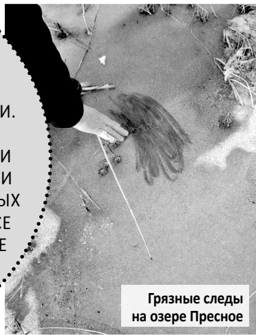
Грязные следы на озере Пресное

Посёлок Дунай и раньше не был избалован заботой и вниманием администрации ЗАТО Фокино, но последние события явно показывают пренебрежительное отношение к жителям и их мнению в решении важных вопросов, касающихся непосредственно населения посёлка.