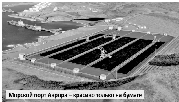
Морской порт Аврора – красиво только на бумаге

СТРОИТЕЛЬСТВО ТЕРМИНАЛА ПРОТИВОРЕЧИТ ВСЕМ ГОСУДАРСТВЕННЫМ ПРОГРАММАМ ПО РАЗВИТИЮ ВНУТРЕННЕГО ТУРИЗМА, ДОСТИЖЕНИЮ ПРАВИТЕЛЬСТВОМ РФ ЦЕЛЕЙ СОЦИАЛЬНО-ЭКОНОМИЧЕСКОГО РАЗВИТИЯ ДАЛЬНЕГО ВОСТОКА, УСТАНОВЛЕННЫХ УКАЗОМ ПРЕЗИДЕНТА, ПОЛОЖЕНИЯМ КОНЦЕПЦИИ ДЕМОГРАФИЧЕСКОЙ ПОЛИТИКИ ДАЛЬНЕГО ВОСТОКА.