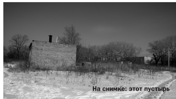
На снимке: этот пустырь

Это большой вопрос для жителей Угловое. Лишь одно упоминание о школе и детском саду вызывает бурное негодование жителей посёлка. Многие родители вынуждены мотаться со своими младшеклассниками по соседним районам. Такая же ситуация в пос. Угловое с детскими садами в райо-