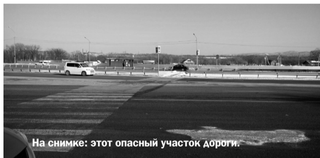
На снимке: этот опасный участок дороги.