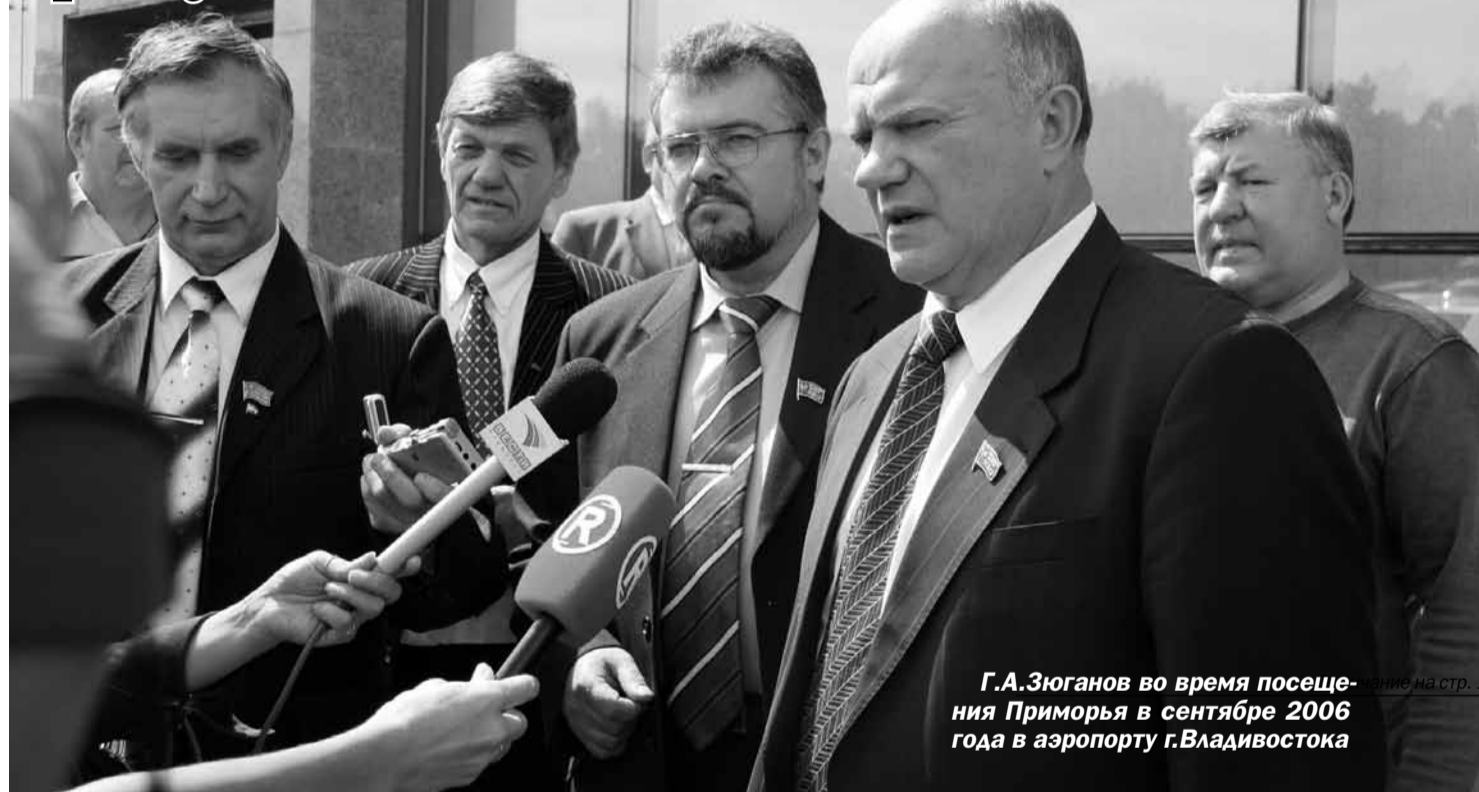
Г.А.Зюганов во время посещения Приморья в сентябре 2006 года в аэропорту г.Владивостока

26 июня исполнилось 70 лет со дня рождения Председателя ЦК КПРФ, руководителя фракции коммунистов в Госдуме РФ Г.А.Зюганова. В этот день в адрес юбиляра пришли многочисленные поздравления от руководителей региональных отделений КПРФ, в том числе и от Приморского краевого отделения КПРФ, от коммунистических партий, входящих в СКП-КПСС, от президентов различных стран и руководителей партий, входящих в состав Думы России. Поздравил с юбилеем Геннадия Андреевича Зюганова патриарх Московский и Всея Руси Кирилл, председатель правительства России Д.А.Медведев, президент РФ В.В.Путин и другие общественные и государственные деятели целого ряда стран.