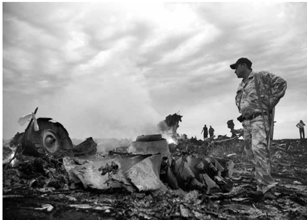
... ПРОТИВ САБОТАЖА

Пассажирский самолет Boeing 777, летевший по маршруту Амстердам — Куала-Лумпур, потерпел крушение 17 июля. Все находившиеся на борту 298 человек погибли. Согласно отчету международных экспертов, причиной катастрофы стало структурное разрушение, вызванное «попаданием в самолет большого количества предметов, обладающих высокой энергией».