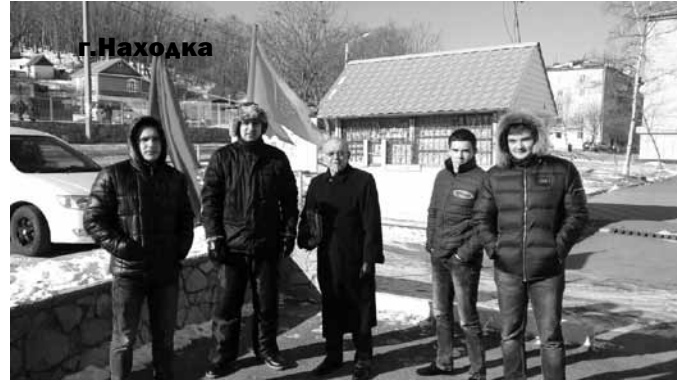
Сегодня эта категория граждан по-прежнему влечет жалкое существование. В то же время,

Звучали также призывы в защиту социально-экономических прав граждан. Коммунисты и их сторонники вышли на площади и улицы городов и посёлков с лозунгами, обличающими политику властей по дальнейшему обнищанию народа, против повсеместного роста цен на продовольственные товары, лекарство и топливо, на ус-