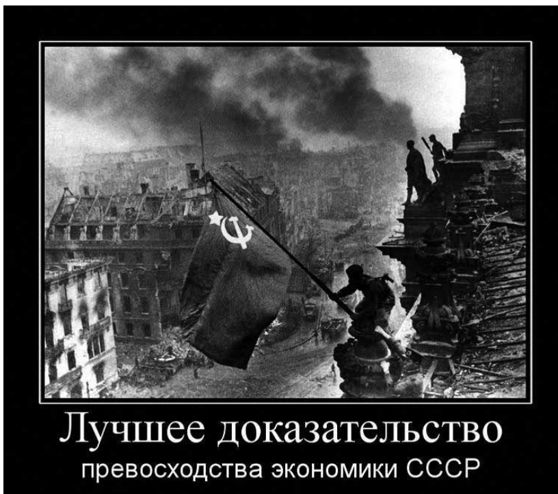
Лучшее доказательство превосходства экономики СССР