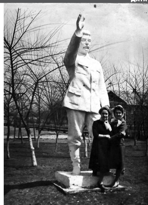
Этот памятник И.В.Сталину находился в пос. Пограничном рядом со зданием ДОСА в советские годы.