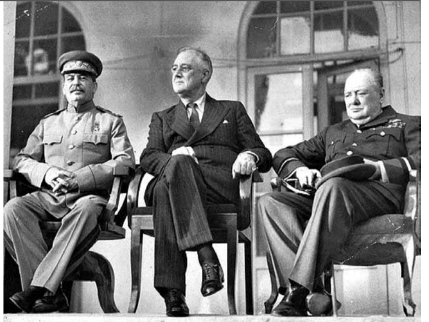
Иосифу Виссарионовичу — 134

Какими бы сложными не были разные этапы истории страны, мы не можем открещиваться ни от одного из них. После развала СССР неолбералы точь-в-точь уподобились столь ненавистным большевикам. Только те отвергли Российскую Империю, а эти — Советский Союз. Чем тогда спрашивается они