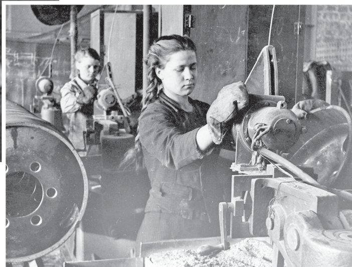
Хрупкие девушки работали на производстве