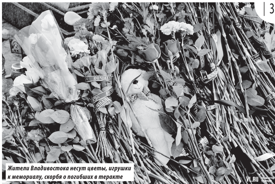
Жители Владивостока несут цветы, игрушки к мемориалу, скорбя о погибших в теракте