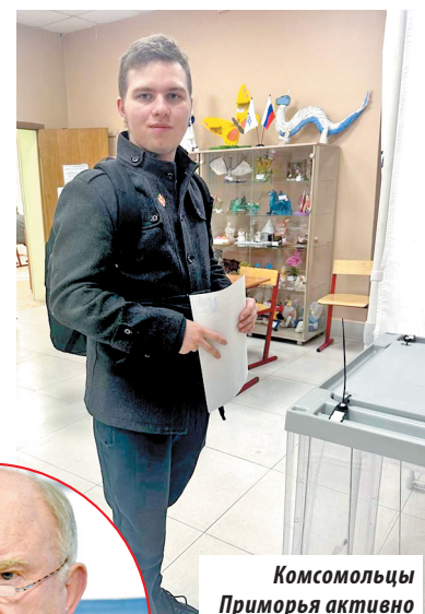
Комсомольцы Приморья активно участвовали в выборах