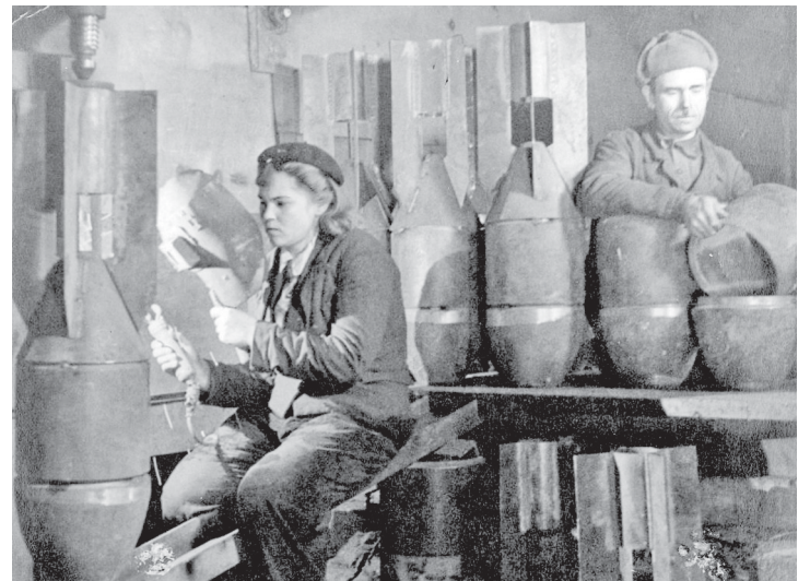
Изготовление авиабомб на комбинате Сихали