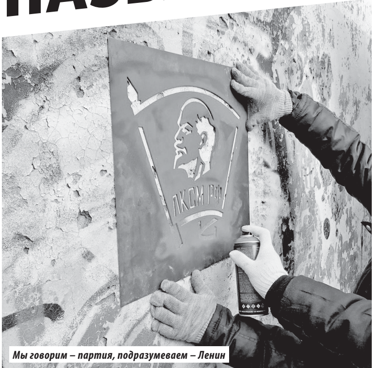
Мы говорим – партия, подразумеваем – Ленин

ЗА ЦИТАТУ ЛЕНИНА ШКОЛЬНИКА ОБВИНИЛИ В ЭКСТРЕМИЗМЕ!