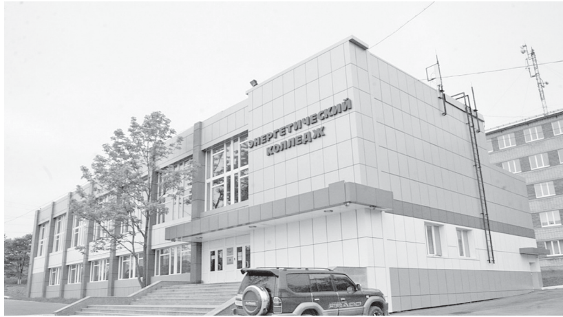
– В МУЗЕЕ ЭНЕРГЕТИЧЕСКОГО КОЛЛЕДЖА ОТВЕДЕН СПЕЦИАЛЬНЫЙ СТЕНД С БИОГРАФИЕЙ МАРИИ АЛЕКСАНДРОВНЫ.