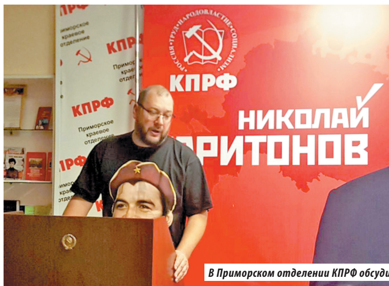
В Приморском отделении КПРФ обсудили итоги выборов