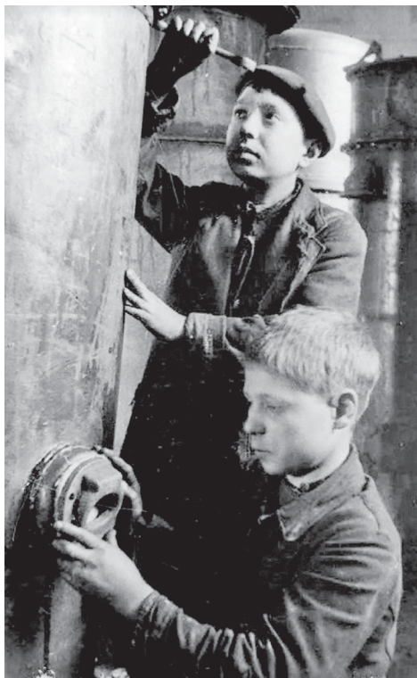
Подростки заменили в цехах мужчин.