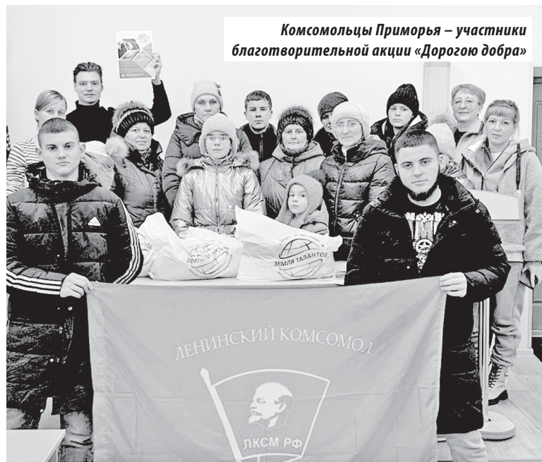
Комсомольцы Приморья – участники благотворительной акции «Дорогою добра»